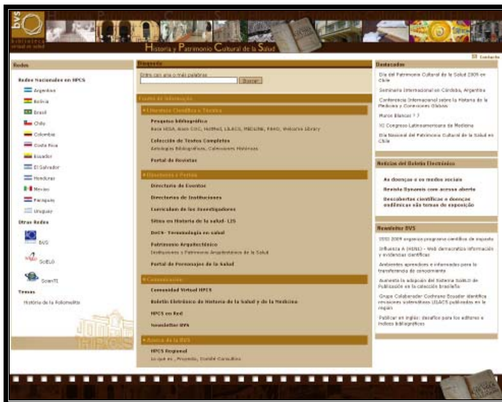
Figura 1: Portal de la BVS HPCS - http://hpcs.bvsalud.org/

instancia de convergencia para la promoción, organización y realización de la cooperación técnica entre las instituciones relacionadas con la Historia y el Patrimonio Cultural de la Salud. Su modelo está basado en la gestión compartida de fuentes y flujos de información y conocimiento tratados como bienes públicos y operados en red en la Web, con el objetivo de aumentar la visibilidad y los usos sociales del conocimiento científico, técnico y factual en Historia y Patrimonio Cultural de la Salud.